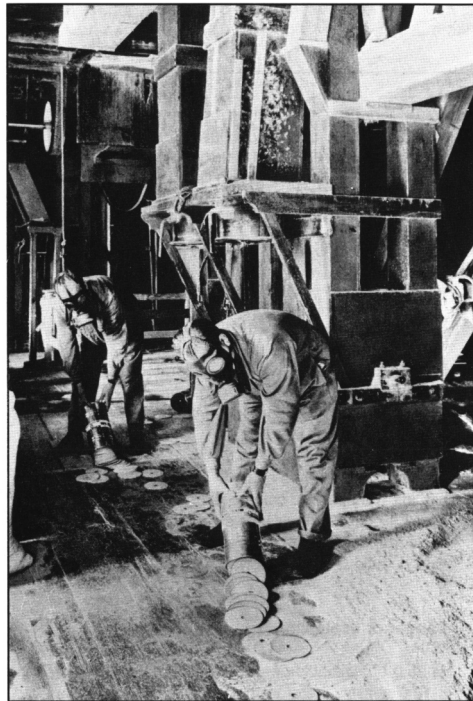
Document 4 : Ces deux personnes équipées de masques à gaz utilisent le Zyklon-B comme insecticide dans une usine.